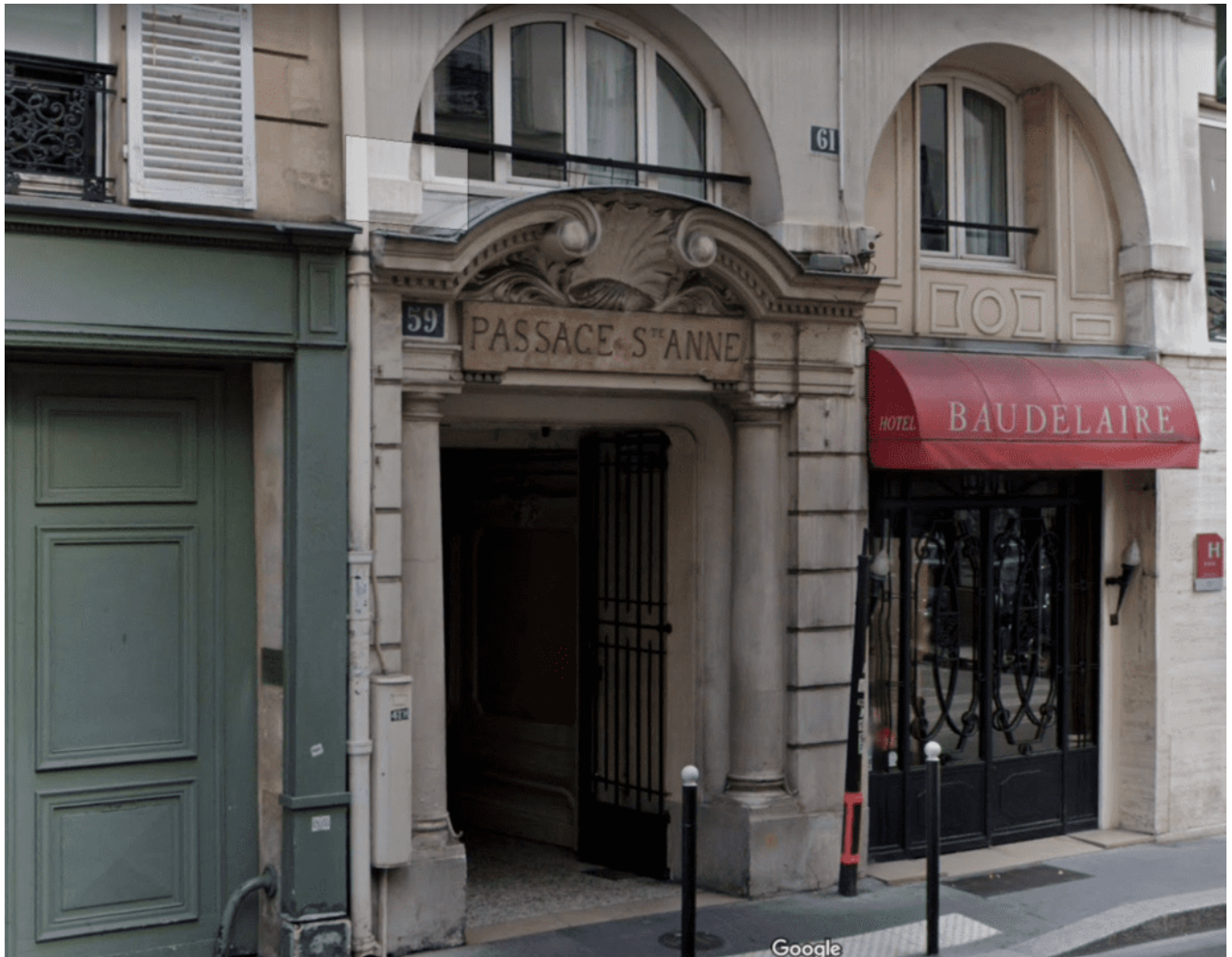
Passage Sanite-Anne, lugar que dava acesso àquela que foi a primeira sede da Sociedade Parisiense de Estudos Espíritas

que existem, mundo afora. Não. Nas ruas da França, parece que o único lugar em que o querido professor merece uma lembrança é no cemitério, como que por obrigação, e onde, morto e enterrado, não chama a atenção de ninguém com suas ideias “subversivas”.